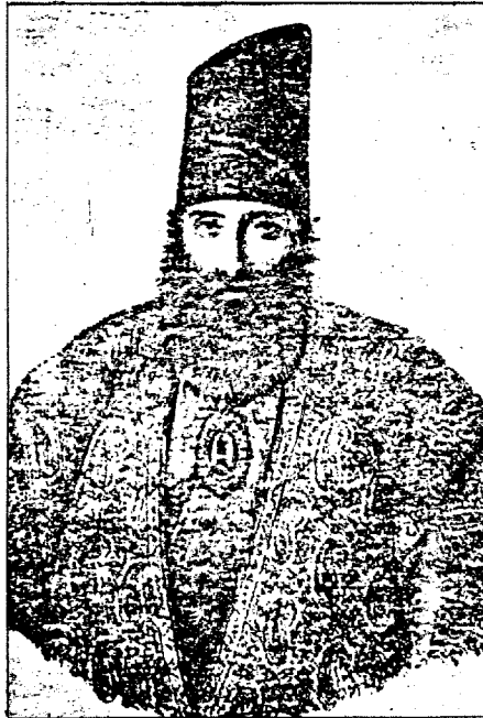
عباسقلی خان جوانشیر معتمدالدوله