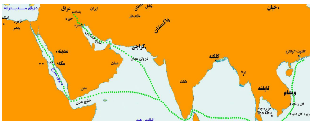
نقشه (مسیر دریایی تجارت چین)

به دو بخش منفک می‌شد: مسیر اول در امتداد خلیج فارس تا ابله [Al Ablah] (نزدیک نهر شط العرب شمال شهر بصره کنونی) پیش می‌رفت و ادامه مسیر به سمت شمال در رودخانه دجله به بصره و نهایتاً به بغداد می‌رسید. مسیر دیگر به سمت خلیج عدن در انتهای جنوب غربی شبه جزیره عربستان ادامه پیدا نموده و به جده و دیگر بنادر دریای سرخ می‌رسید.