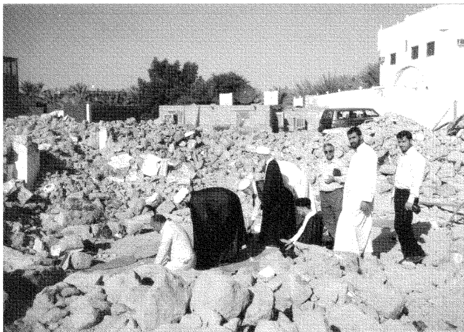
خرابه‌های مسجد بنی قریظه